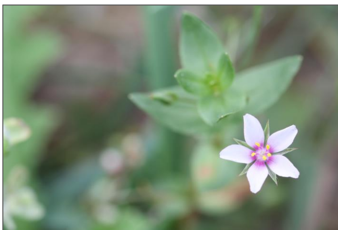
Drchnička modrá, drobný plevel polí a úhorů patří mezi ohrožené druhy české květeny.

V roce, kdy je experimentální plocha rozorána, se postupně vytváří vegetace složená převážně z polních plevelů a dalších jednoletých synantropních rostlin (merlík bílý, bér sivý, hořčice rolní, silenka noční, drchnička modrá). Druhové složení se lokalita od lokality liší. Je to dáno různými půdními a vlhkostními podmínkami.