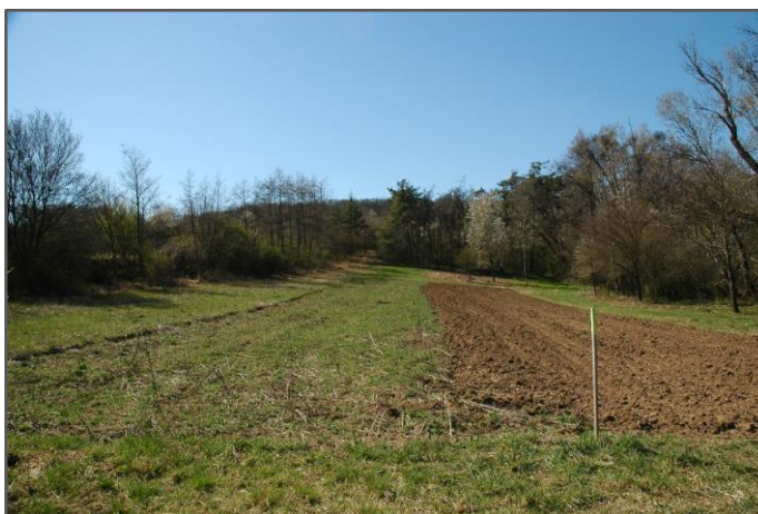
Hnanice – u potoka Daníž, pohled na TTP vlevo, víceletý úhor uprostřed a nově rozoranou část vpravo.

V roce, kdy je experimentální plocha rozorána, se postupně vytváří vegetace složená převážně z polních plevelů a dalších jednoletých synantropních rostlin (merlík bílý, bér sivý, hořčice rolní, silenka noční, drchnička modrá). Druhové složení se lokalita od lokality liší. Je to dáno různými půdními a vlhkostními podmínkami.