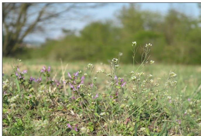
Kráví hora, huseníček rolní (Arabidopsis thaliana) a hluchavka objímavá (Lamium amplexicaule), jedny z prvních kvetoucích rostlin úhorů.

Území NP Podyjí bylo do poloviny 20. stol. téměř odlesněnou krajinou, s četnými mlýny na řece Dyji, obhospodařovanými poli a loukami na úživnějších pozemcích a pastvinami a vinicemi na sušších svazích. Toto území se však po roce 1948 začalo výrazně měnit v důsledku zřízení hraničního pásma. Přítomnost vojsk Pohraniční stráže a existence drátěných zátarasů (od roku 1951 až do roku 1989) neúmyslně přispěly k rozvoji ekosystémů a přirozenému prostředí pro zvířata i rostliny. Větší část zemědělských pozemků se tak změnila v „divočinu“.