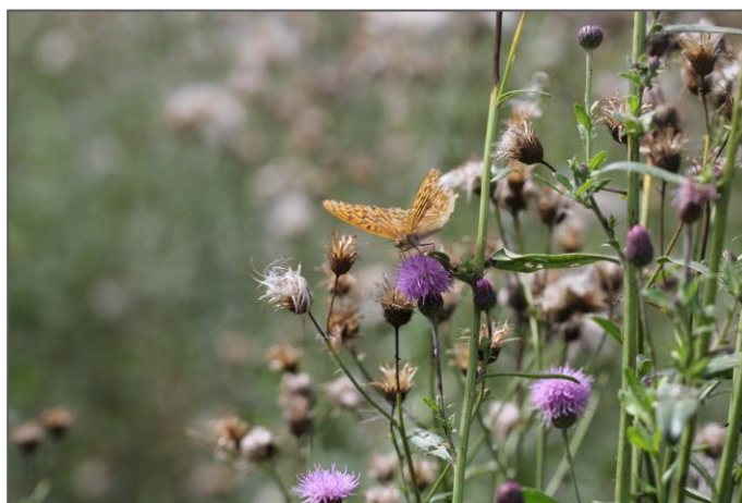
Perleťovec stříbropásek je charakteristickým motýlem kvetoucích úhorů.

Význam úhorů je nejlépe docenitelný v otevřené krajině, kde zvláště starší stadia se stromy a keři působí jako stabilizační prvek.